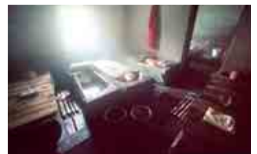
Kuren wie anno dazumal – im 300 Jahre alten Karlbath an der Nockalmstraße

Urige Hütten und Gasthäuser laden hier zur Einkehr ein. Hier werden typische Kärntner Spezialitäten serviert, wie zum Beispiel die Brettljause: Speck, Almkäse, Hartwürste und Schwarzbrot, auf einem Holzteller angerichtet. Oder das Kärntner „Nationalgericht“, die berühmten Käsnudel. Aber auch die köstlichen Fleischgerichte vom Nockalmrind, das hier auf den Almen grast, sollte man probieren. Als Nachtisch wird Reindling kredenzt, der aus Gernteig gemacht und mit Nüssen, Rosinen, Zimt und Zucker gefüllt wird. Darauf passt ein „Zirbenschnaps“, aus den Zapfen des Zirbenbaumes hergestellt – aber den trinkt besser nur der Beifahrer. Bei den Bauernmärkten auf der Zechneralm und der Glockenhütte werden all diese heimischen Köstlichkeiten auch zum Kauf angeboten. Die Schiestlscharte ist die nächste Passhöhe auf 2.024 m und von hier geht's knapp neun Kilometer Kehre auf Kehre hinunter nach Ebene Reichenau. In Patergassen biegt man rechts nach Bad Kleinkirchheim ab, dem beliebten Thermalbad und bekanntem Wintersportgebiet.