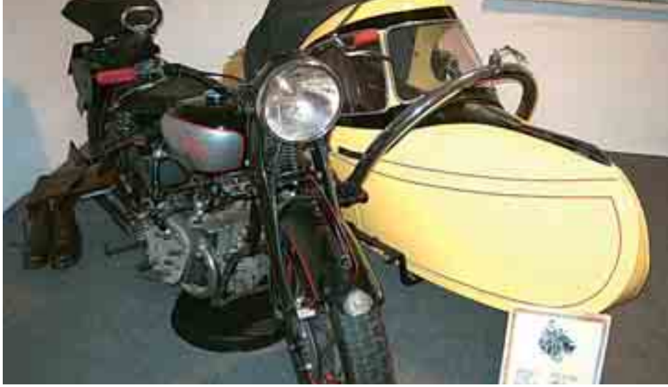
Oldtimer- & Bauernkram-Museum