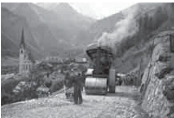
Nur fünf Jahre lang dauerte der Bau der Straße – eine bauliche Meisterleistung in den 30ern

Vor knapp 75 Jahren wurde die Großglockner-Hochalpenstraße eröffnet. Sie zählt zu den berühmtesten Alpenstraßen und führt mitten durch den Nationalpark Hohe Tauern zum höchsten Berg Österreichs, dem Großglockner. 48 Kilometer reines Fahrvergnügen mit 36 Kehren durch eine einzigartig Gebirgswelt bei einem Höhenanstieg bis auf 2.504 Meter.