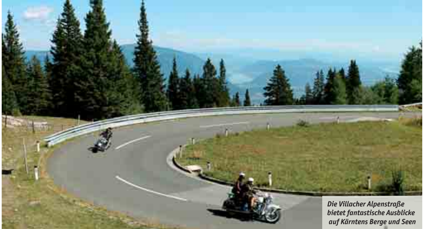
Die Villacher Alpenstraße bietet fantastische Ausblicke auf Kärntens Berge und Seen

Infos: KÄRNTEN WERBUNG GmbH, Casinoplatz 1, 9220 Velden, Österreich Tel.: 0043 (0)4274 / 52100, Fax-DW - 50 E-Mail: info@kaernten.at www.kaernten.at, www.motorrad.kaernten.at