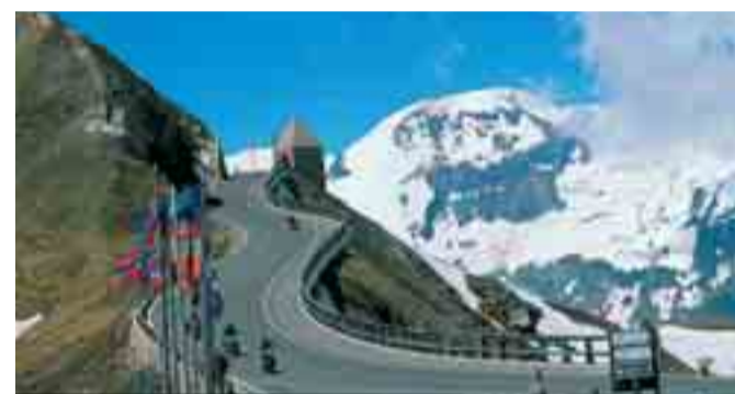
Perfekter Blick auf die unvergleichliche Hochgebirgslandschaft mit über 30 Dreitausendern beim Fuscher Törl

schönsten Panormastraßen Österreichs – die Großglockner-Hochalpenstraße, die Nockalmstraße und die Gerlos-Alpenstraße – zum Sonderpreis „erfahren“. Dieses preisgünstige Ticket erhält man im Vorverkauf bei allen Mitgliedsbetrieben der ARGE Motorradland Kärnten zum Vorzugspreis von nur € 20,- (Ersparnis € 30,-). Neben den drei genannten Straßen gibt es mit diesem Ticket auch noch den Zusatzbonus zum Bezug einer preisreduzierten Karte um € 4,- für die Villacher Alpenstraße und das Großglockner-Bonusticket, das zu einer zusätzlichen, entgeltfreien Fahrt auf den Großglockner innerhalb von zehn Tagen ab der Erstfahrt berechtigt.