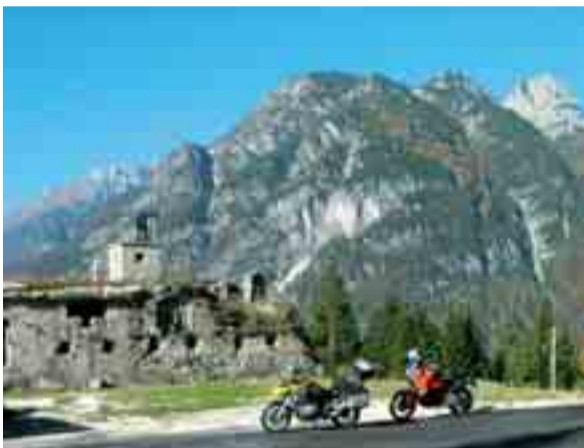
Entlang der Tour findet man steinerne Zeugen des Ersten Weltkrieges

Eine aufregende Tagestour durch drei beeindruckende Länder: Kärnten, Slowenien und Italien. Für alle, die Lust auf Kurven und Höhenmeter haben und dabei viel sehen, erleben und genießen wollen.