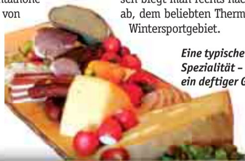
Eine typische Kärntner Spezialität – die Brettljause, ein deftiger Genuss

Besonders für Naturliebhaber ist die Fahrt durch den Nationalpark Nockberge ein unvergessliches Erlebnis. Ihren Namen verdanken die Berge übrigens den sanften Kuppen, auf Kärntnerisch „Nock'n“ genannt. Eine erdgeschichtliche Rarität, die einzigartig im gesamten Alpenraum ist und die der Landschaft einen besonderen Reiz gibt. Wer mehr über den Nationalpark Nockberge, seine charakteristische Tier- und Pflanzenwelt erfahren will, der findet entlang der Straße viele interessante Ausstellungen, Lehrpfade und Rundwege. Erreicht man den höchsten Punkt der Nockalmstraße, die Eisentalhöhe auf 2.042 m, genießt man von der Aussichtsplattform einen einzigartigen Rundblick auf das Nockalmgebiet. Hier befindet sich ein „Biker's Point“ – ein Park- und Rastareal, das nur für Motorradfahrer reserviert ist.