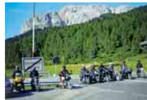
Über den Nassfeldpass, den Passo Pramollo mit seinen 1.552 m, geht's zurück nach Kärnten

die Straße etwas holprig, aber auf österreichischer Seite ist sie sehr gut ausgebaut. Auf der Passhöhe sollte man bei „Da Livio“ einkehren, um noch einmal typisch italienische Gerichte zu gustieren. Oder aber in einem der bodenständigen Restaurants auf der Kärntner Seite, wo man mit Köstlichkeiten aus der Kärntner Küche und der Gailtaler-Speck-Käse-Straße verwöhnt wird. Die Abfahrt nach Tröpolach bietet tolle Kurven und Kehren und so manchen schönen Ausblick. Im Tal geht's dann weiter nach Hermagor und durch das weite, grüne Gailtal cruist man gemütlich nach Villach zurück.