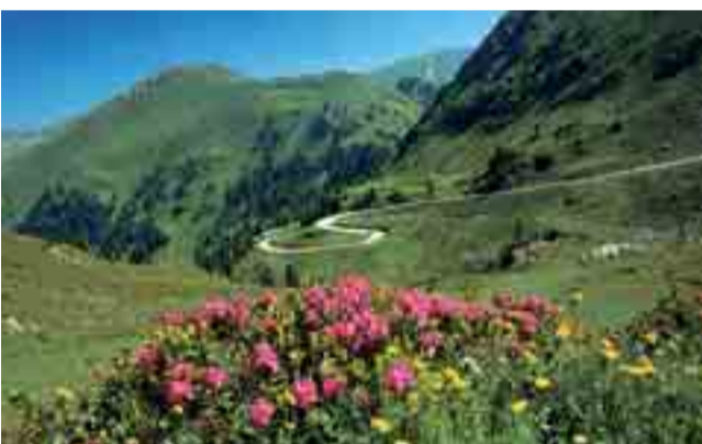
Die 35 km lange Panoramastraße führt durch den Nationalpark Nockberge

Die idyllische Nockalmstraße im Nationalpark Nockberge ist das Ziel dieser Tour. Gemütliches Cruisen durch sanftes Hochgebirge mit runden Kuppen und geschmeidigen Kehren – ein unvergessliches Erlebnis für Naturliebhaber.