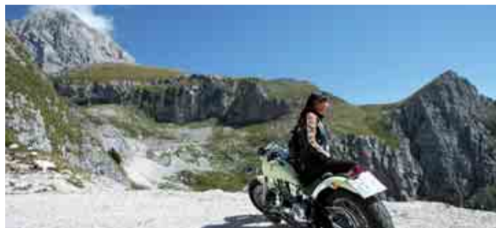
Kurze Rast am Fuße des Mangart – fantastischer Rundblick inklusive

Weiter geht es über den Ort Soča auf den Predil-Pass (Passo del predil, 1.156 m) in Italien. Wer möchte, kann kurz vor der Grenze