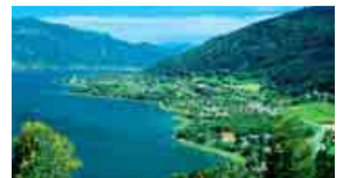
Am Fuße der Gerlitzen liegt der Ossiacher See, einer der schönsten Badeseen Kärntens

Über Radenthein geht es durch das idyllische Gegendtal nach Feld am See, Afritz am See und Treffen. Wer Lust hat, kann hier eine Runde um den Ossiacher See, den drittgrößten Badesee Kärntens drehen oder der Draustadt Villach einen Besuch abstatten. An der großen Kreuzung Villach/Ossiacher See biegt man rechts nach Villach ab und fährt auf der Bundesstraße weiter Richtung Spittal an der Drau. Nach der Draubücke nimmt man die Abzweigung nach Villach und ein paar hundert Metern weiter dann rechts nach Bad Bleiberg, dem gesündesten Hochtal Kärntens mit Thermalbad und Heilklimastollen. Weiter geht's nach Labientschach, wo man rechts nach Kerschdorf abbiegt. Über ein grünes Hochplateau mit herrlichem Blick über das Gailtal fährt man bis nach St. Stefan und auf der Gailtal-Bundesstraße zurück nach Hermagor.