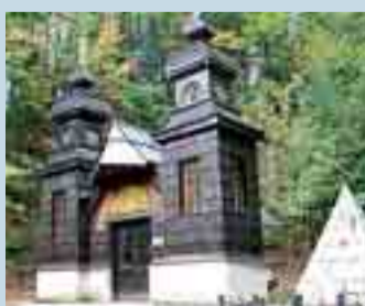
Russische Kapelle am Vršič

Einkehrtipp: „Restaurant Lipa“ in Kranjska Gora, „Gostilna Martinov hram“ in Bovec, „Al buon arrivo“ und „Vecchia Rosticceria“ in Resiutta, „Ristorante San Gallo“ und „Leon Bianco“ in Moggio Udinese, „Da Livio“ am Nassfeldpass, „Alpenhof Plattner“ und „Das Stüberl“, Österreichs höchstgelegenes 3-Hauben-Lokal am Nassfeld, „Bachmann's“ in Obervellach bei Hermagor